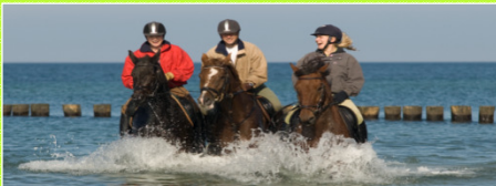
Projekt „Reiten in M-V“